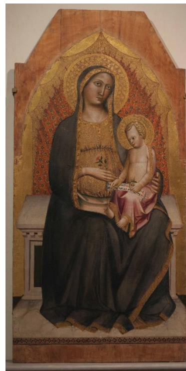
Madonna col Bambino già centro di un polittico, del Maestro di San Jacopo a Mucciana (c. 1405), ora nel Museo d'arte sacra di Santa Verdiana