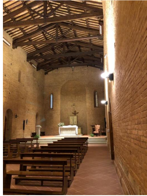
Castelfiorentino, pieve dei Santi Ippolito e Biagio (foto di inizio Novecento e foto attuale)